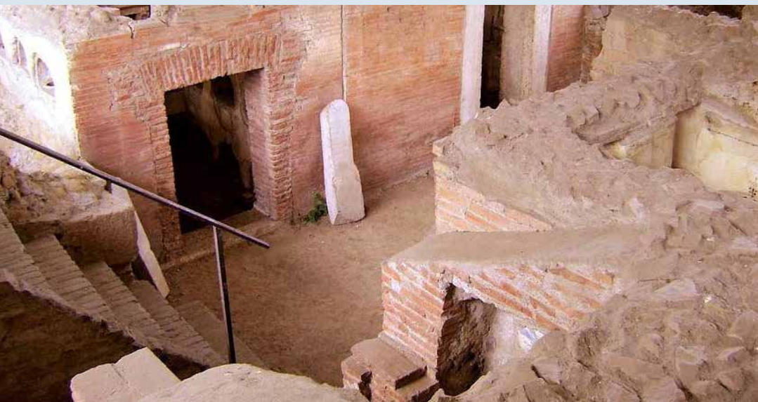
Necropoli Ostiense (besøk onsdag 6/5)

Pomeriggio: L'area archeologica medievale della Basilica di San Paolo è stata aperta definitivamente al pubblico nel 2018. Poco lontano c'è la necropoli ostiense, che conserva la tomba di San Paolo, visitabile solo con un permesso speciale.