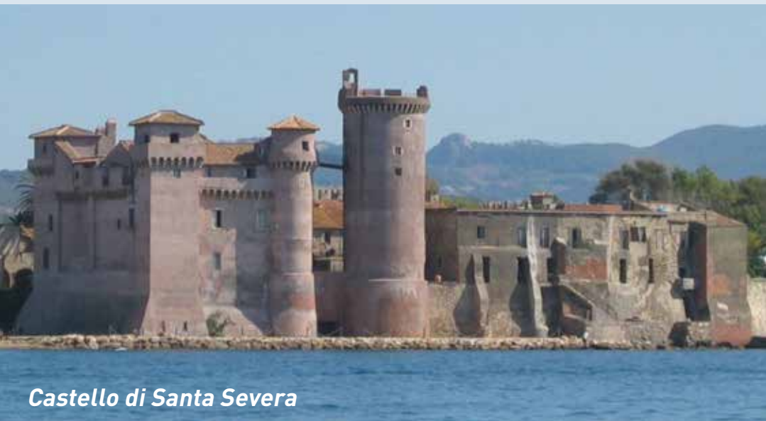
Castello di Santa Severa

È il Museo storico della Liberazione , allestito nei locali che, nei mesi dell'occupazione nazista di Roma, furono utilizzati come carcere e luogo di tortura dalle SS comandate dal colonnello Herbert Kappler.