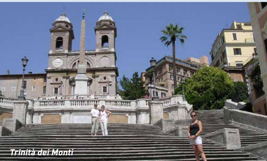
Trinità dei Monti

I språkundervisningen plasseres du sammen med andre på ditt nivå, mens om ettermiddagen er alle sammen og alt skjer på italiensk. Italiensken er forenklet, slik at det skal være lettere for deg som lærer språket, å forstå mest mulig. Vi anbefaler at du minst har kommet til vårt Trinn 3 eller tilsvarende og at du er innstilt på at du kan lære mye, selv om du ikke forstår alt. Det er maksimalt 27 deltagere på reisen - det er deltagere fra mange land og de siste årene har litt mindre enn halvparten vært norske.