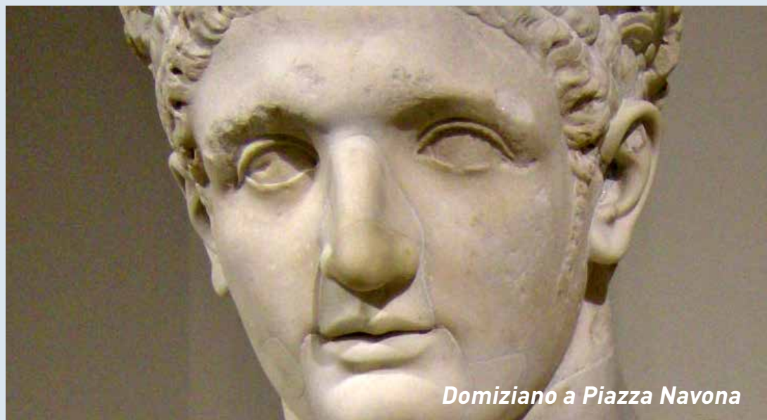
Domiziano a Piazza Navona