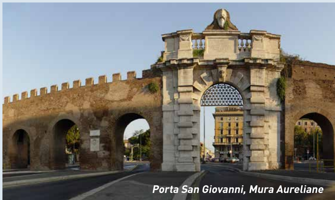
Porta San Giovanni, Mura Aureliane