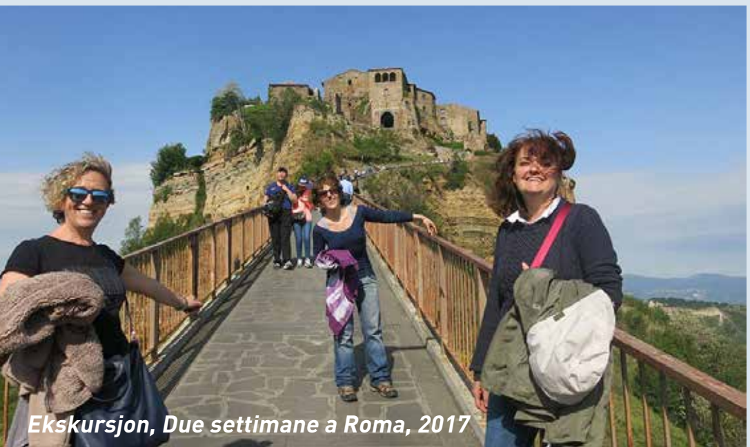
Ekskursjon, Due settimane a Roma, 2017

I språkundervisningen plasseres du sammen med andre på ditt nivå, mens om ettermiddagen er alle sammen og alt skjer på italiensk. Italiensken er forenklet, slik at det skal være lettere for deg som lærer språket, å forstå mest mulig. Vi anbefaler at du minst har kommet til vårt Trinn 3 eller tilsvarende og at du er innstilt på at du kan lære mye, selv om du ikke forstår alt. Det er maksimalt 27 deltagere på reisen - det er deltagere fra mange land og de siste årene har litt mindre enn halvparten vært norske.