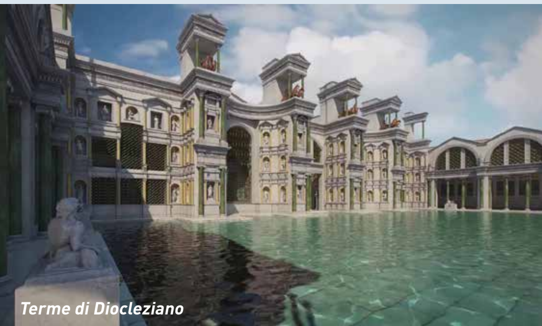
Terme di Diocleziano

Nel pomeriggio andiamo alla Crypta Balbi, uno dei luoghi più interessanti e meno conosciuti di Roma. Grazie agli scavi archeologici, qui è possibile seguire la storia di un quartiere dal I secolo a.C. fino al XX secolo, perché quest'area è stata abitata ininterrottamente per quasi duemila anni. È come assistere, in diretta, alle trasformazioni che hanno caratterizzato l'intera città. Finiamo la visita con una passeggiata nell'antico Ghetto di Roma.