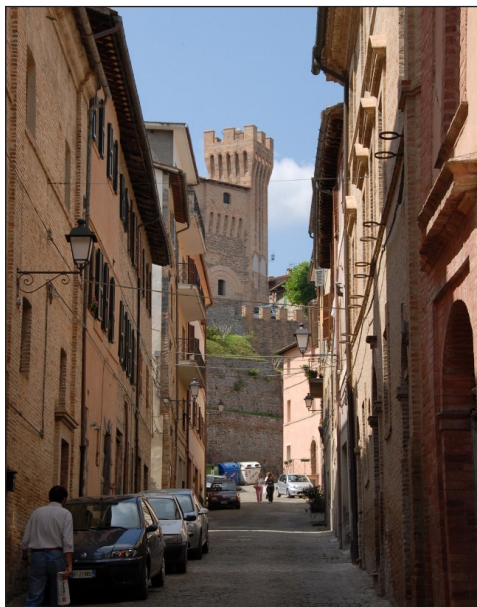
Castello Palotta i bakgrunnen

Litt senere spiser vi lunsj på en sjømatrestaurant i byen Sirolo som ligger høyt oppe på en klippe med fantastisk utsikt ut over Adriaterhavet. Mineralvann og vin er inkludert.