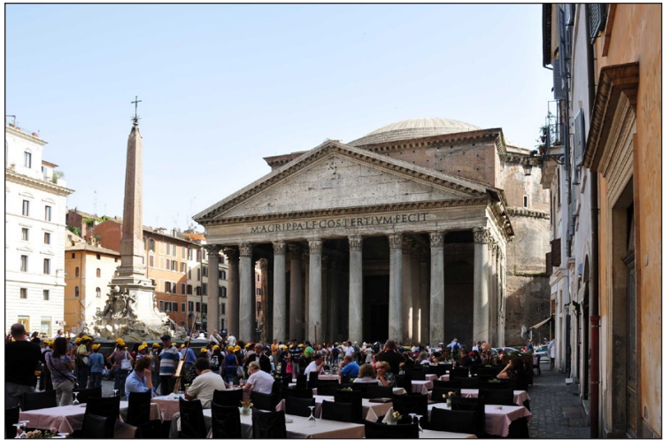
De to siste dagene opplever vi Roma. Bl.a. det kjente tempelet Pantheon.

På veien hjem kjører vi innom byen Fermo . Også en by med sin opprinnelse i romertiden, bl. a. finnes her et romersk amfiteater. Middag på hotellet.