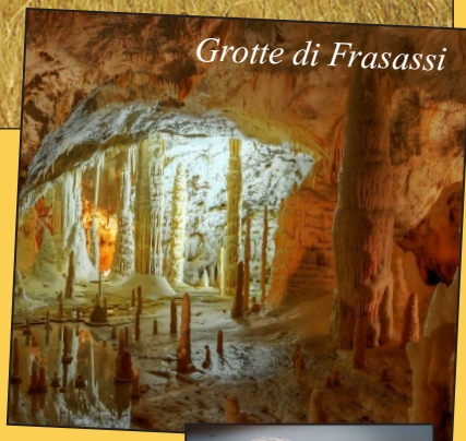
Grotte di Frasassi